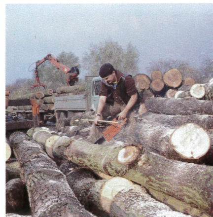
Hout zagen SBF.

‘De in het mijnwezen gangbare boetekas werd gevuld met boetes die aan mijnwerkers werden opgelegd’