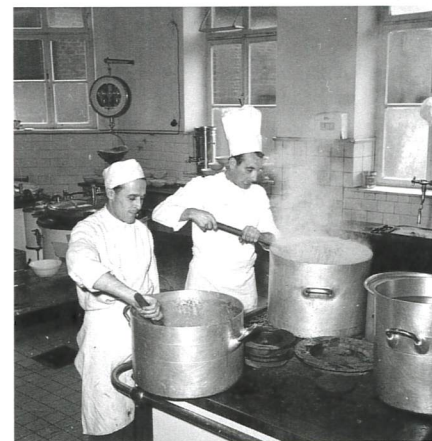
Keukenpersoneel gezellenhuis Leyenbroek.