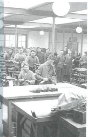
schoenfabriek WIM Trebbeek.