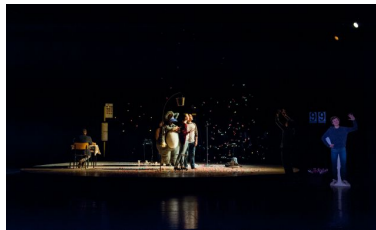
De tijd die nooit stilstaat, het nieuwe jaar dat nooit iets nieuws brengt.

Loopstation van theatergezelschap Ontroerend Goed is een meditatie over onze dagelijkse routines en het houvast van herhaling. Een sobere reflectie over monotonie, ingesleten patronen en de onverzettelijke voortgang van de tijd.