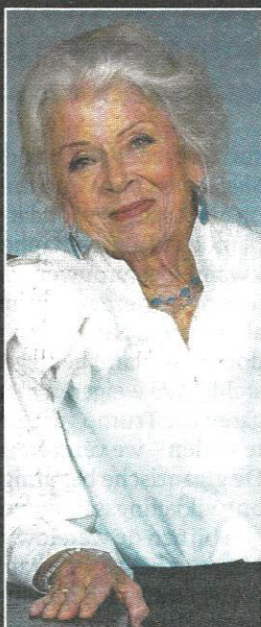
▲ Sonja Barend.